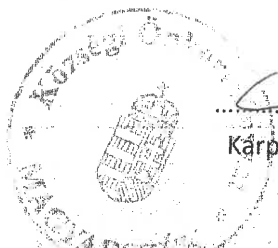
Kárpáti Jenő polgármester