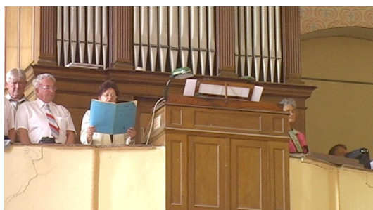
A misecsengő megszólalásának pillanatában készült felvétel (2008.08.31. 11:05)

történo megjelenését. (Nincs lehetőségünk, és eddig sem éltünk cenzúrázással az újság hét éves fennállása alatt – a szerk.)