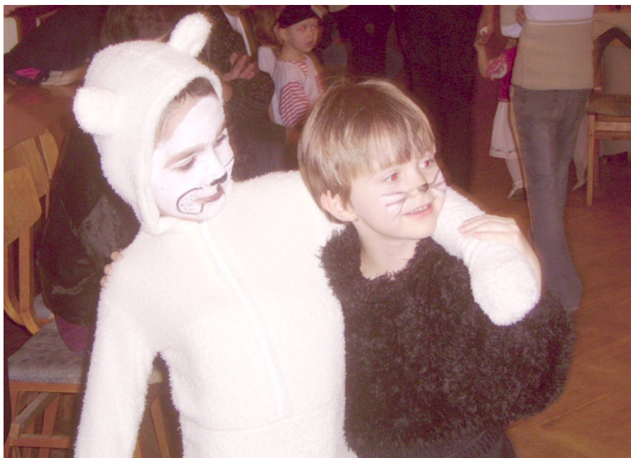
A Szülői Szervezet és az óvodapedagógusok közös szervezésében került sor az óvodások farsangi báljára. Köszönetet mondunk minden szülőnek, támogatónak: az alapanyagokért, gyűjtésekért, a munkáért és mindennemű segítségért, amit csak kaptunk. A Kisgömböc c. mesét adtuk elő közösen a szülőkkel, nagy sikert aratva. Köszönjük a vállalkozó kedvű szülőknek a szereplést és a jelmezes felvonulást is. Több mint százán voltak ránk kíváncsiak.