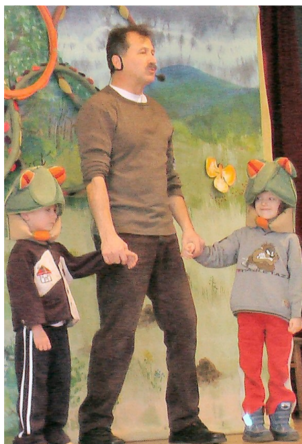
A „Hangoló” Zenés Színház vidám előadása „Állatolimpia” címmel a Faluházban, március 6-án. A tagóvodákból érkezettekkel együtt élveztük a műsort.