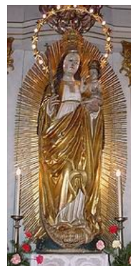
A Csíksomlyói Segítő Mária nagy faszobra a kegytemplom főoltárának díszeként. (15. század)

A csíksomlyói búcsút, a székelyek nagy ünnepét hagyományosan pünkösdkor tartják. Messzi földről érkeznek a zarándokok a kegytemplomhoz Máriát dicsőíteni. Története 1567-re nyúlik vissza, amikor is a székelyek legyőzték János Zsigmond seregeit a Hargita Tolvaj-hágójánál. Ennek a győzelemnek az emlékére kezdtek el a hívek a kegyhelyre járni, hogy pünkösd napján együtt várják a szentlélek eljövételét. Manapság 5-600 ezer hívő is eljön a világ minden tájáról. A csángók, a székelyek, a magyarok együtt imádkoznak a Szűz Anyához, sokan nyírfaágot tartanak a kezükben, amit Mária szimbólumnak tartanak. A körmeneten gyakran felcsendül a Boldogasszony anyánk és a Székely himnusz.